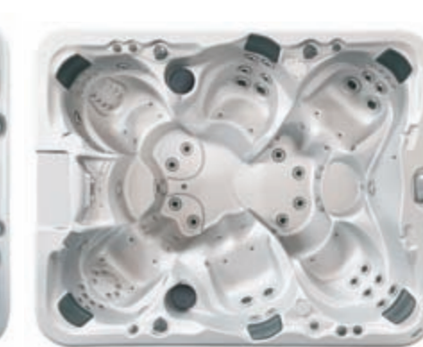
ROCK N ROLL